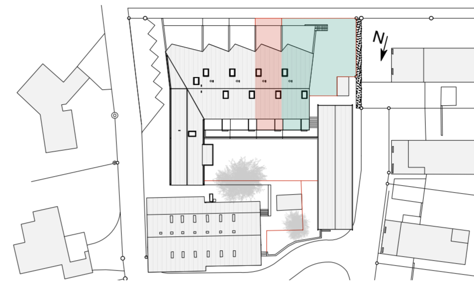
Situationplan 1. Randhaus 2. Reihenhäuser