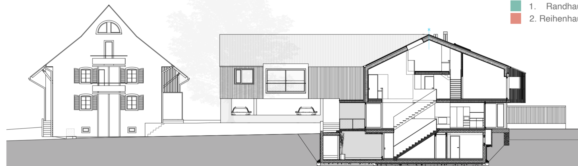
Schnitt A - A'