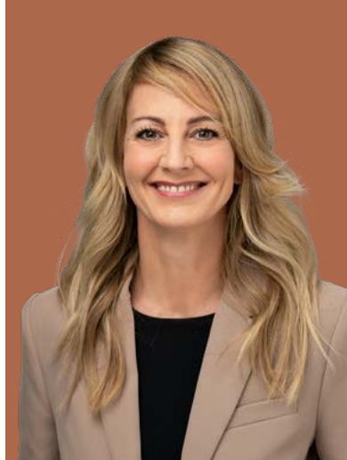
Leiterin Neubau MAS Immobilienmanagement Betriebsökonomin FH

Im persönlichen Kontakt lernen wir uns kennen. Erzählen Sie uns von Ihren Ideen, wir stehen Ihnen als kompetenter Partner zur Seite.