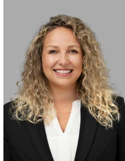
Stv. Leiterin Neubau Immobilienvermarkterin mit eidg. FA Immobilienbewirtschafterin mit eidg. FA