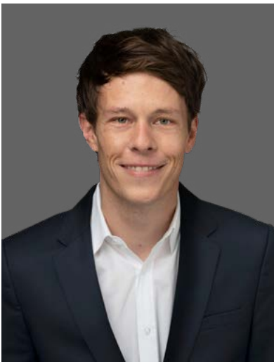
Neubau Marketing Manager