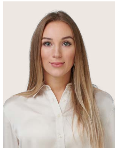
Immobilienberaterin Dipl. Betriebswirtschafterin HF