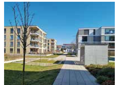
Geplante Wohnüberbauungen in Bachenbülach, Zürich und Oftringen.