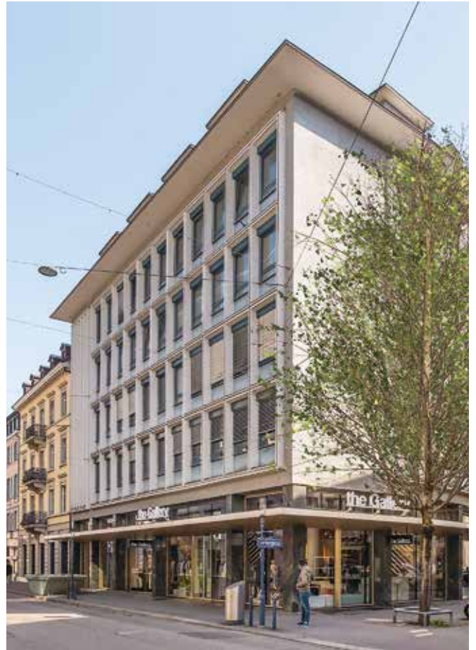
Markstein AG Zürich: Löwenstrasse 40 in Zürich.