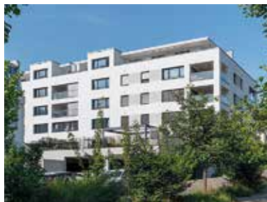
Wohnüberbauungen in Wettingen, Olten und Rorschach.