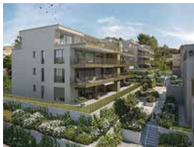
Wohnüberbauungen in Kleindöttingen, Frick und Urdorf.