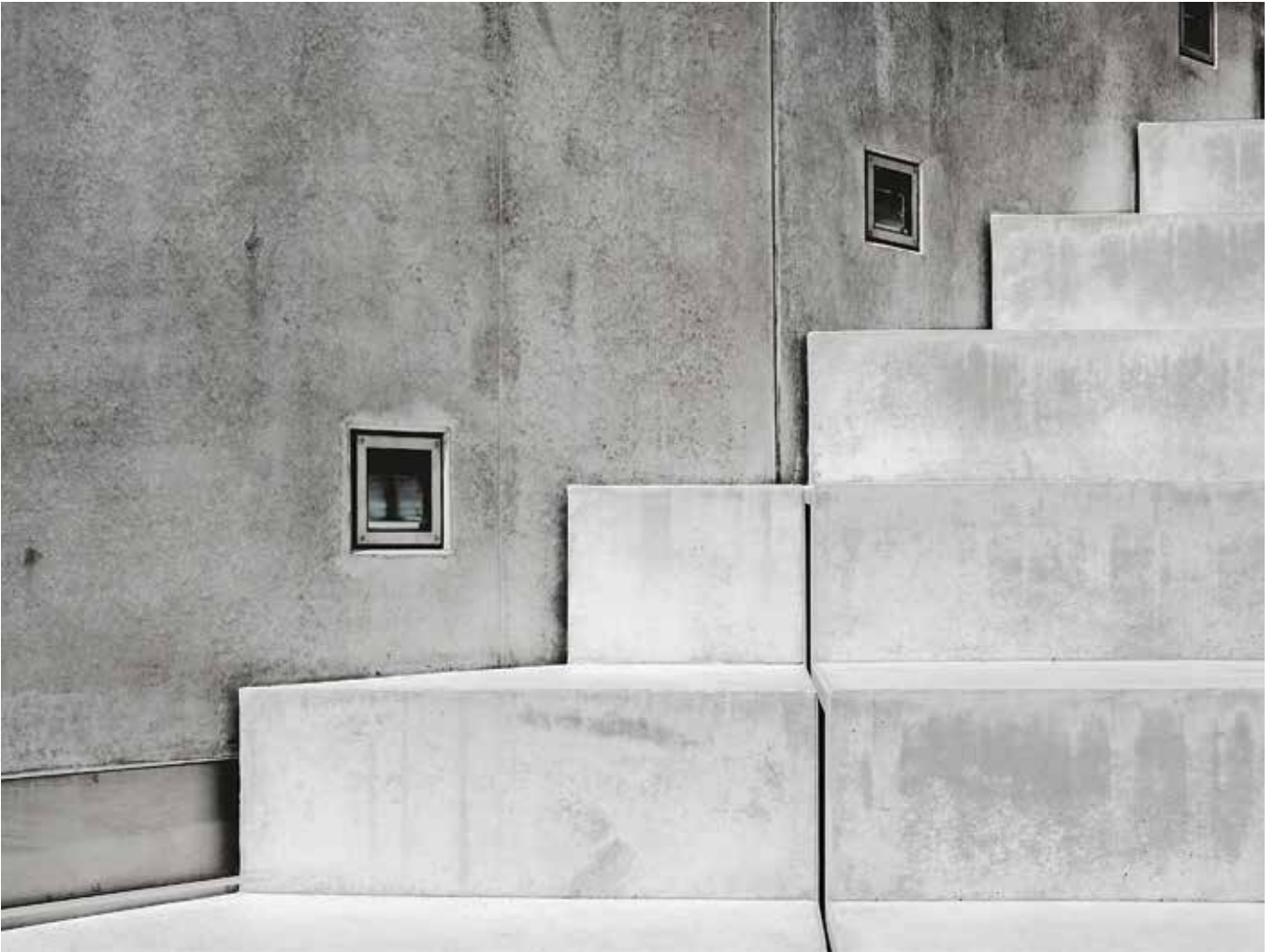
Step by Step zu noch besserer Qualität: Markstein arbeitet an der Optimierung jedes einzelnen Arbeitsschritts.

befriedigend aus. Zur Vorbeugung arbeiten wir an den wichtigen Prozessen und bringen sie ins Bewusstsein, um sie optimieren zu können. Eingespielte Abläufe und Handlungen hinterfragen wir, was die Chance bietet, Verbesserungen herbeizuführen. Das ist ein stetiger Entwicklungsprozess. Er macht die persönliche Verantwortung sichtbar und führt zu einem höheren Nutzen für alle.