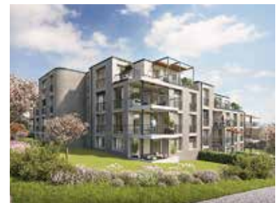
Liegenschaften in Birr, Buchs ZH und Zürich.