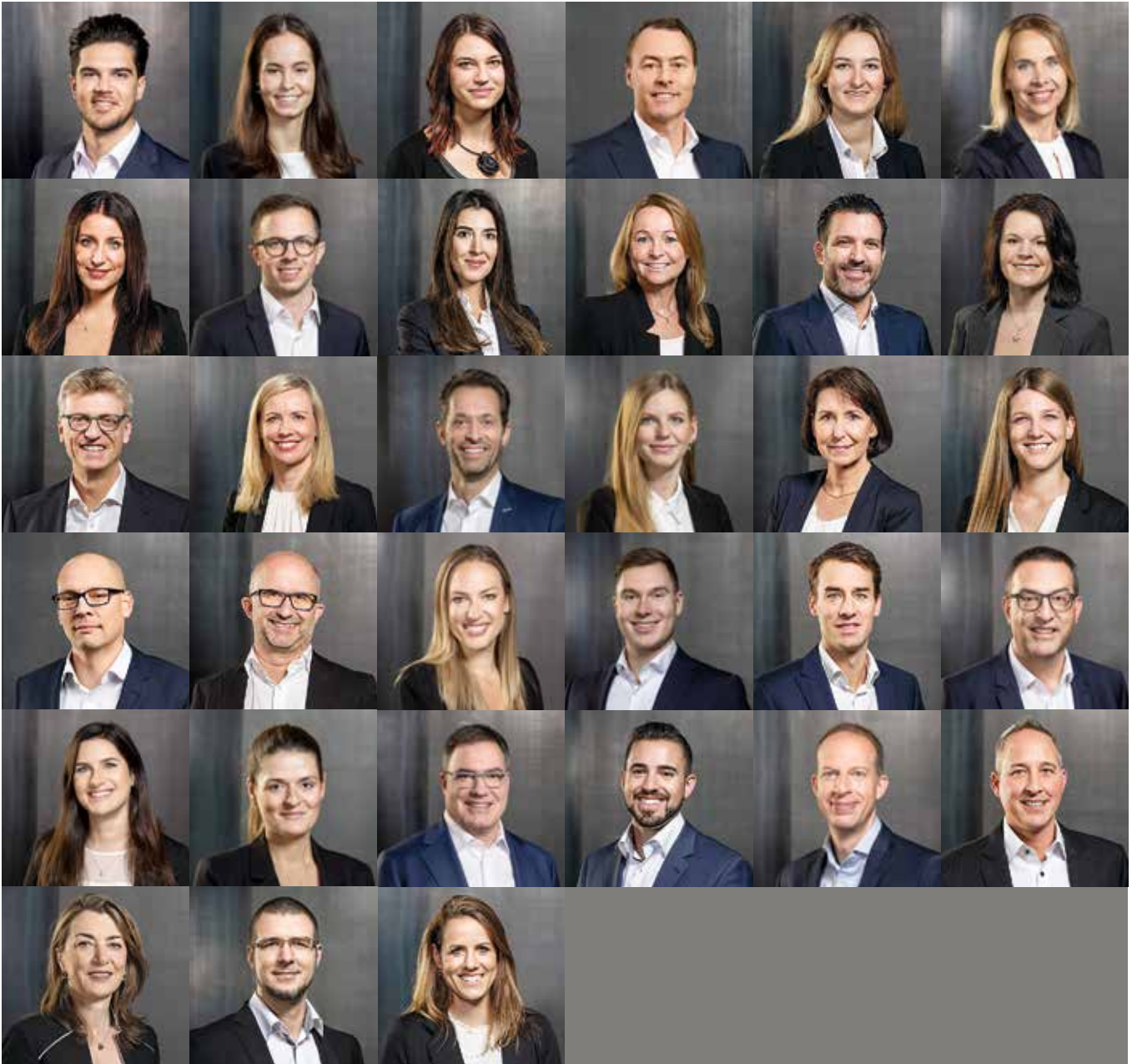
Verkörpern unser Markenversprechen: Die Mitarbeitenden von Markstein.

Seriös heisst für Markstein, hoch konzentriert zu arbeiten und sich diskret, ernsthaft und vertieft mit der Materie zu beschäftigen. Wir lassen uns mit echtem Interesse auf unsere Aufgaben ein. Dabei stellen wir die Bedürfnisse unserer Kunden fokussiert und integer in den Mittelpunkt. Wir nehmen unsere Vorbildfunktion wahr, kommunizieren offen und ehrlich und gehen respektvoll miteinander um.